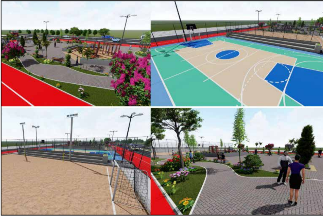
O projeto contempla um espaço para jogos de tabuleiro, com pergolado e mesinhas de jogos em concreto. (Página 04).