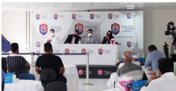
Reunião do Conselho Técnico definiu os detalhes acerca da Série B do Baianão.