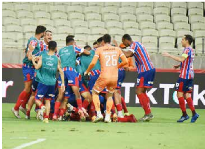
Jogadores do Bahia comemoram a classificação para a final da Copa do Nordeste.