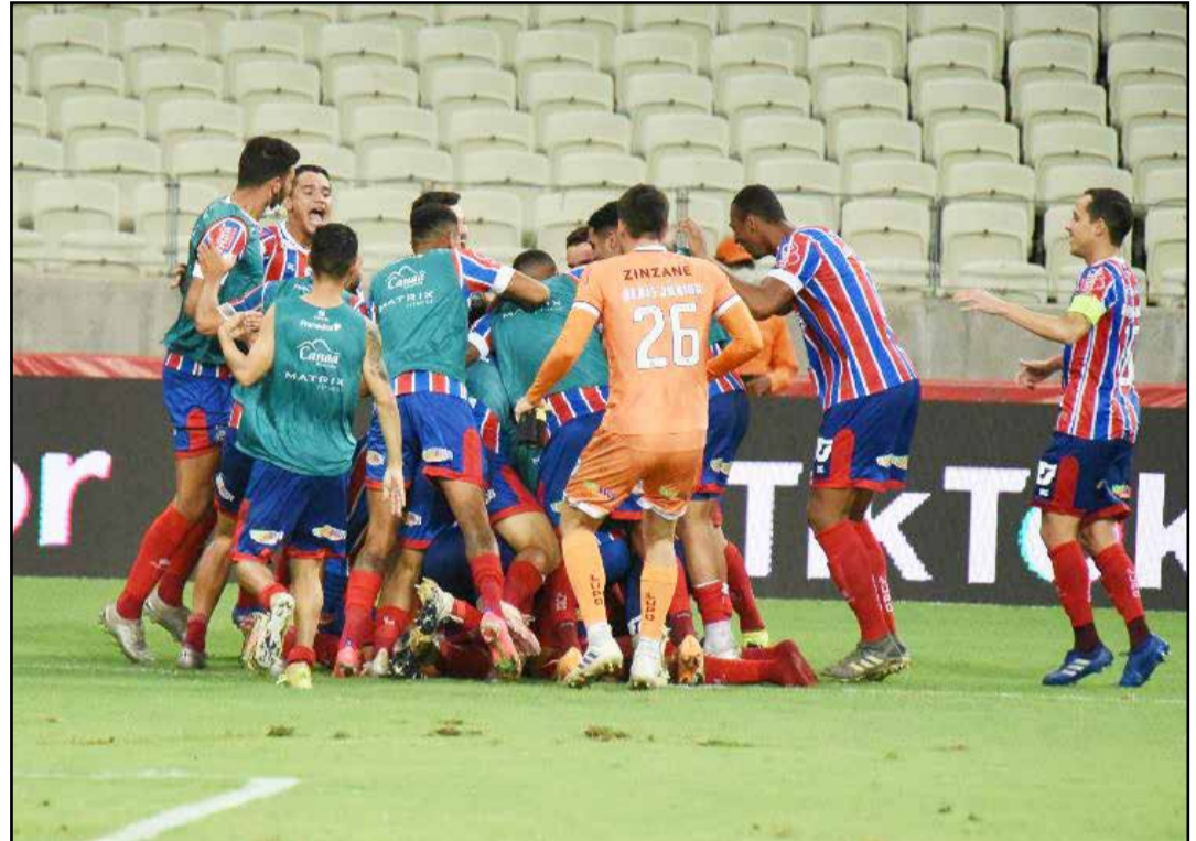
Jogadores do Bahia comemoram a classificação para a final da Copa do Nordeste. (Página 08).