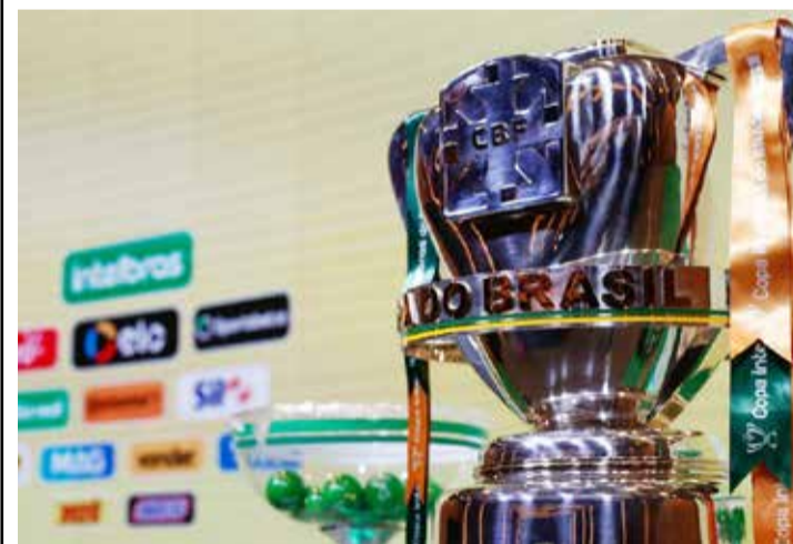
Sorteio foi realizado na última sexta-feira (23) - Foto: Divulgação (CBF).

O campeão da Copa do Brasil 2021 pode faturar o acumulado de até R$73,6 milhões. Por Redação Diário Esportivo