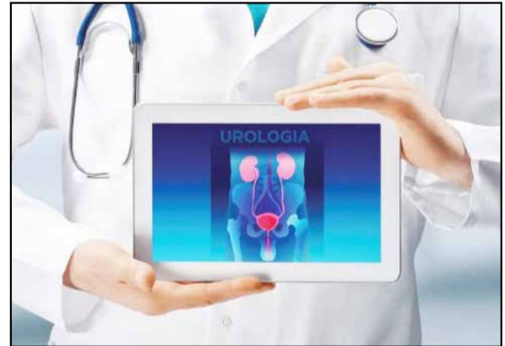
Especialistas alertam para importância de visitar o urologista mesmo na pandemia. (Página 06).

REINVENTE-SE! RENOVE SUA IDENTIDADE VISUAL.