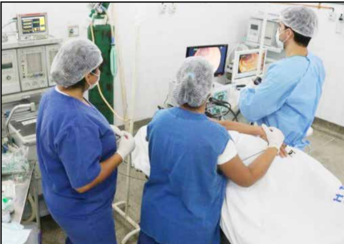
A colonoscopia é um exame que captura imagens do intestino grosso e de parte do íleo terminal (porção final do intestino delgado). (Página 06).