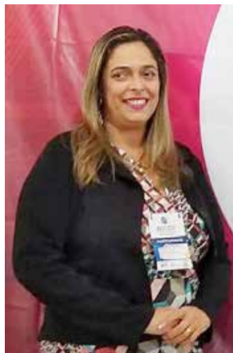
Por Guilhermina Elisa Bessa da Costa*

A luta em prol do reconhecimento da Língua Brasileira de Sinais é marcada por uma trajetória de lutas e desafios para a comunidade surda, pois durante muito tempo os surdos não tinham acesso ao conhecimento da estrutura da LIBRAS e em consequência não estavam inseridos na escola, pois não tinham os seus direitos garantidos por Lei, como por exemplo a presença de intérpretes de LIBRAS em sala de aula, fato que dificultava o acesso e permanência nas instituições escolares e além disso, ainda eram vítimas de preconceito e tinham dificuldade de inserção no mercado de trabalho, pois não havia uma ampla difusão da Língua brasileira de sinais.